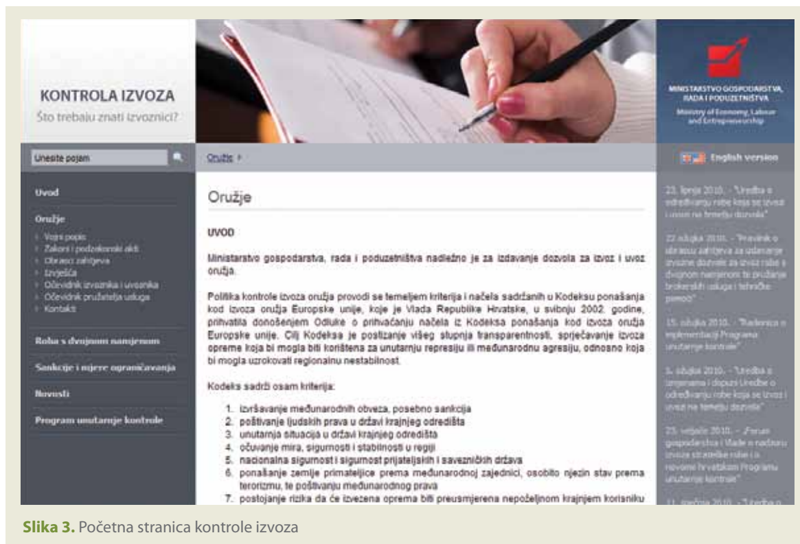
Slika 3. Početna stranica kontrole izvoza