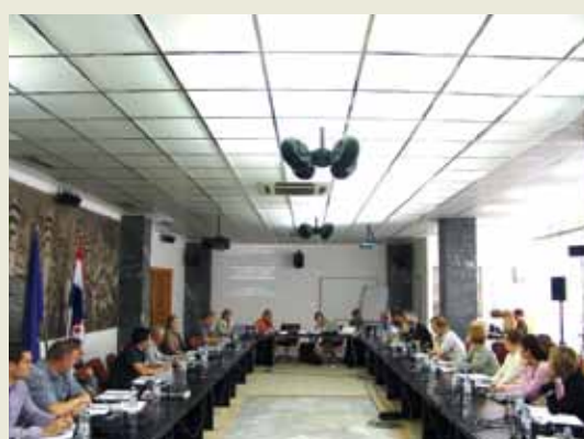
Slika 2. Seminar sa predstavnicima industrije