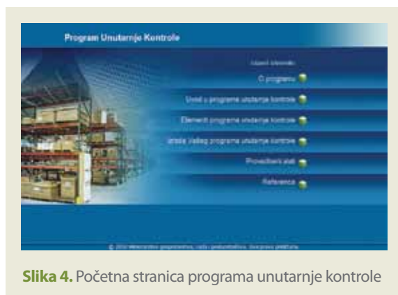
Slika 4. Početna stranica programa unutarnje kontrole

Riječ je o novom naprednom internetskom alatu koji služi kao pomoć tvrtkama da prilikom izvoza robe posluju u skladu s hrvatskim i međunarodnim propisima kontrole izvoza. PUK je besplatan i dostupan je na web stranicama http://icp.mingorp.hr/ . Izgled početne stranice prikazan je na slici 4.