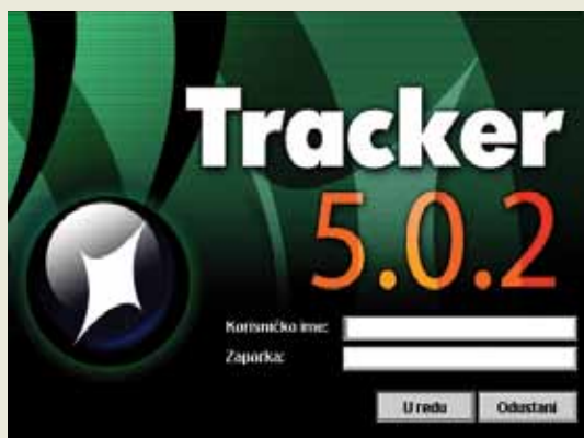
Slika 1. Početna stranica programa TRACKER

Od 1. siječnja 2009. godine, kada je započela primjena Zakona o izvozu i uvozu robe vojne namjene i nevojnih ubojnih sredstava, nadležna ministarstva su kontinuirano