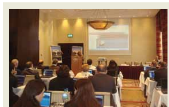
Slika 5. Predstavljanje PUK-a industriji

Tijekom narednog perioda biti će organizirane regionalne radionice kako bi se tvrtkama iz ostalih regija Hrvatske omogućilo upoznavanje s Programom unutarnje kontrole i podigla svijest o kontroli izvoza, radi sprječavanja međunarodnog terorizma i širenja oružja za masovno uništavanje.