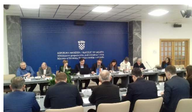
3. sjednica Nacionalnog inovacijskog vijeća, 6. svibnja 2019.

REPUBLIKA HRVATSKA Ministarstvo gospodarstva, poduzetništva i obrta